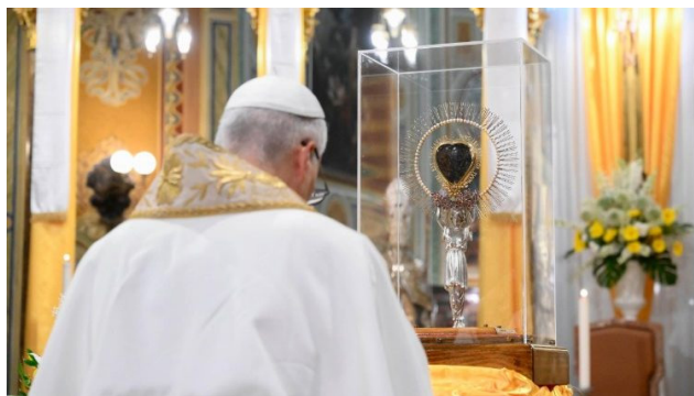
Veneración del Corazón de Santa Francisca Cabrini.

El Papa aterriza en el estadio municipal «Carlo Chiesa» tras un brevísimo trayecto en helicóptero. Para recibirlo allí y a lo largo de las calles se han reunido más de 7.000 personas, mientras que en la basílica, a la que ha llegado en papamóvil, hay unas mil. A pesar de la larga tarde y del