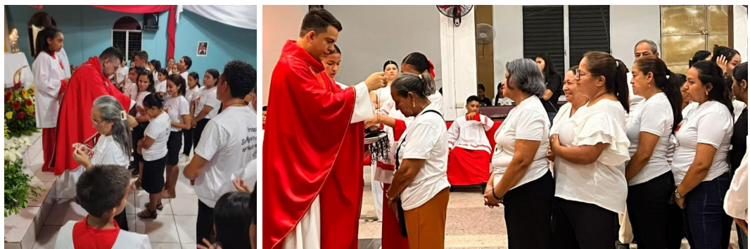
Parroquia San Miguel Arcángel de Potrerillos.