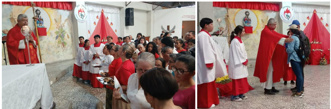
Envío misionero parroquia Santísima Trinidad de Chamelecón.

La etapa de La Siembra finaliza en la Solemnidad de Cristo Rey e inicia la tercera etapa, Crecimiento: Que es el momento de mantener los frutos de la misión y de continuar el proceso de maduración en la fe y el compromiso evangelizador en comunidad.