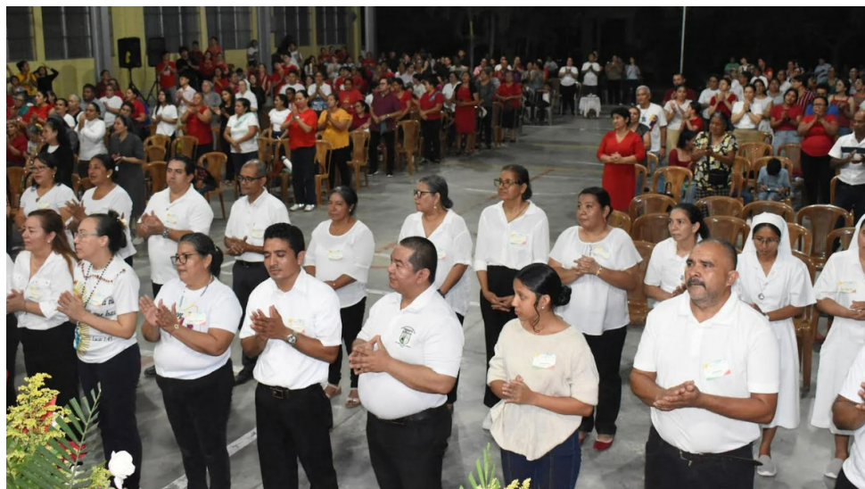
Envío de la parroquia Nuestra Señora de Suyapa de la colonia López Arellano.

E n medio de la gran alegría de Pentecostés, varias parroquias de nuestra Arquidiócesis de San Pedro Sula realizaron su envío misionero en la fiesta de Pentecostés; algunas lo hicieron en la vigilia del 23 de mayo, otras el domingo 24 de mayo, día de la fiesta del Espíritu Santo y cumpleaños de nuestra Iglesia católica.