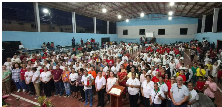
Envío de la parroquia Nuestra Señora de Guadalupe de La Lima.