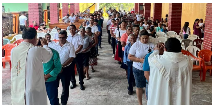
Parroquia Nuestra Señora del Carmen de Yojoa.