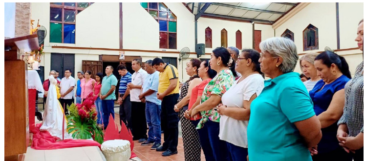
Envío misionero de la parroquia Santiago Apóstol colonia Luisiana.