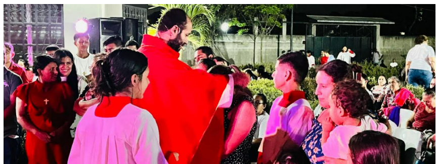
Envío de la parroquia Medalla Milagrosa colonia Edilberto Solano, sector López.