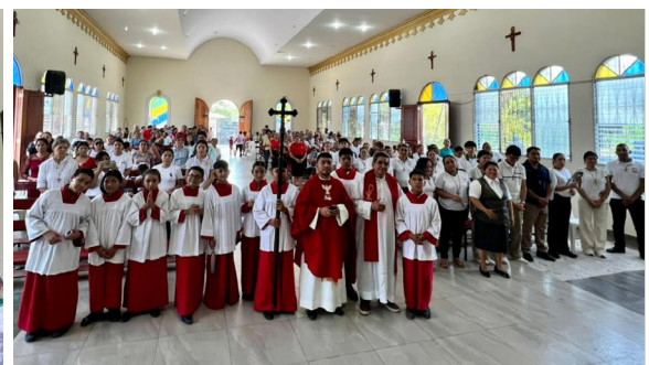
Envío de la parroquia Inmaculada Concepción de María.