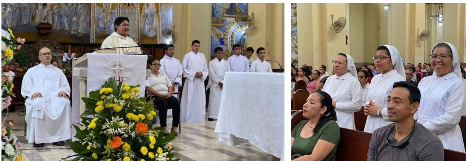
Catedral San Pedro Apóstol, misa de inauguración de la 63 Jornada Mundial de Oración por las Vocaciones.