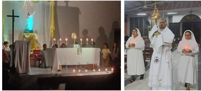
Hora Santa por las vocaciones.

Las parroquias de nuestra Arquidiócesis de San Pedro Sula han realizado diferentes actividades para promover las vocaciones, esto en el marco de la celebración de la 63 Jornada Mundial de Oración por las Vocaciones, que se desarrolló del 19 al 26 de abril.