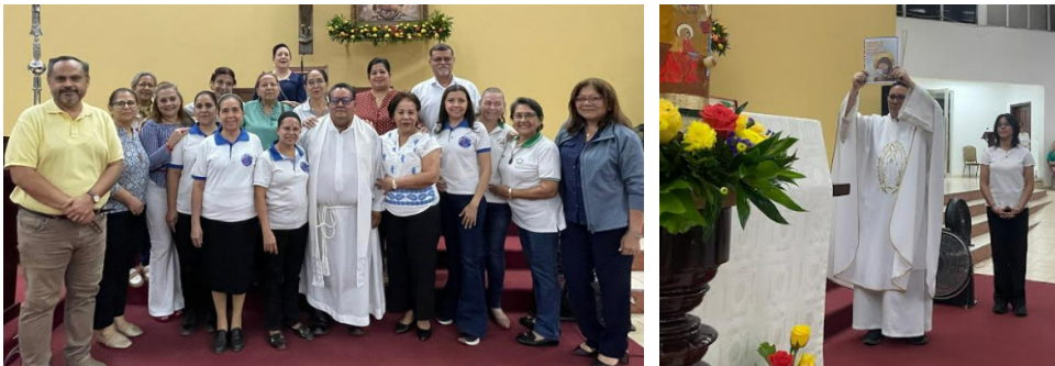
Parroquia Nuestra Señora de Guadalupe.