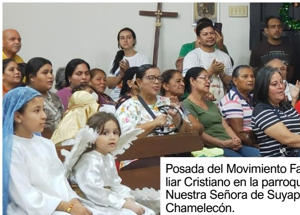
Posada del Movimiento Familiar Cristiano en la parroquia Nuestra Señora de Suyapa Chamelecón.