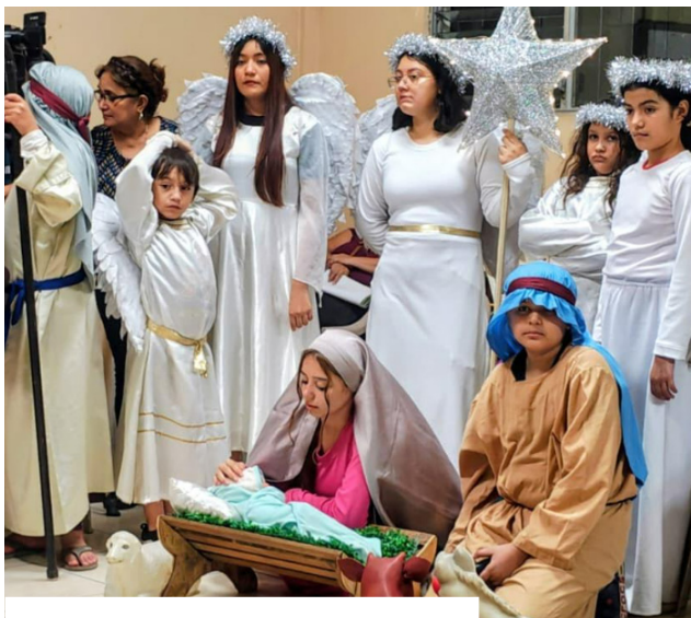
Posada del Apostolado Católico Israel.

Es importante recordar que las posadas más que una fiesta, son un ejercicio espiritual que nos invitan a ser más solidarios y acogedores, viviendo la Navidad no solo en lo exterior, sino en interior del corazón. Con las posadas los católicos fortalecemos valores como la hospitalidad, la solidaridad y la unión familiar y comunitaria.