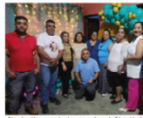
Como ha sido su experiencia como madre en la Educación de sus hijos.