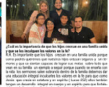
Como ha sido su experiencia como madre en la Educación de sus hijos.